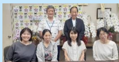
5月11日 英検模試 サポートメンバー

7月5日(金) 漢検本試験28名 準2→2名 3級→14名 4級→4名 5級→7名 8級→1名(小学生)