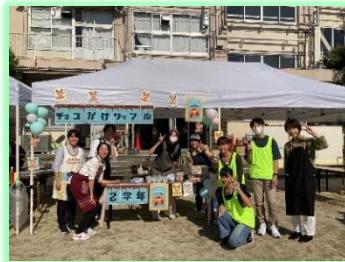
2学年/チョコかけワッフル