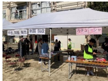
本部/カチューシャ