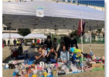
オリーブ/フリーマーケット