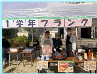
1学年/フランクフルト