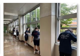
窓清掃でピカピカ