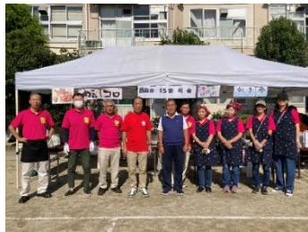
西新井15部町会/からコロ・かき氷