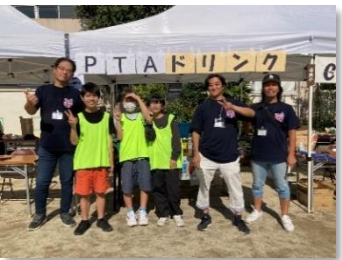
本部/ソフトドリンク