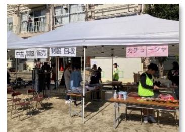
成人委員会/中古制服販売・回収