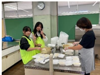
おやじの会/キーマカレー