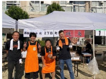
西新井本町二丁目町会/焼き鳥