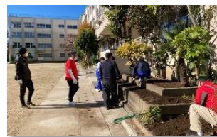
チューリップの球根植えました。

五中の伝統でもある5VT。生徒たちは教職員、保護者や地域の方々と力を合わせて学校美化・校庭清掃・地域清掃に取り組みます。昨年、秋の5VT後の豚汁、おにぎりが復活し、生徒たちの喜ぶ顔も見る事ができました。皆様のご参加、ご協力をお待ちしております。