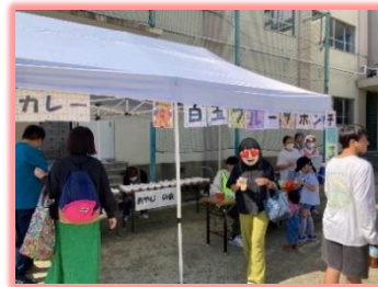
3学年/白玉フルーツポンチ