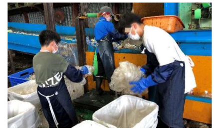
【日本衛生リサイクルサポート】