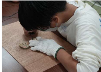
【木のキーホルダづくり】