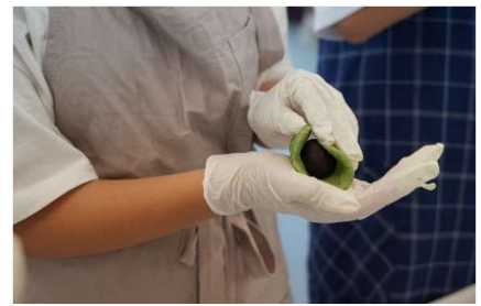
【↑笹団子づくり】 【↓稲刈り】

15日は雨に見舞われましたが、予定通りすべてのプログラムを行うことができました。稲刈り・飯盒炊飯・フォトラリー・食育(笹団子づくり)の体験を通して、SDGs、共同作業、魚沼地域の方との交流など、たくさんのお話を学びました。