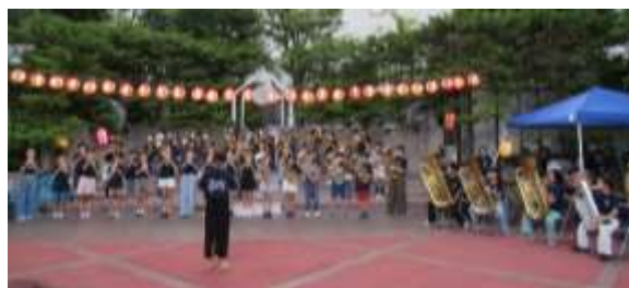
地域の夏祭りで演奏する様子

金管バンドは現在、6年生24名、5年生18名、4年生17名の計59名でにぎやかに活動しています。火曜日から金曜日の朝練習、月に一度の土曜練習に加えて、夏休みにも13日間練習を行いました。6年生がリーダーシップを発揮し、下級生にアドバイスをしたり、自分たちで音を合わせたりして練習を進めています。また、外部講師の先生からもご指導をいただき、日々音を磨いています。8月、9月には地域の3つのお祭りに出演し、「美女と野獣」や「ラ・バンパ」などの5曲を披露しました。子供たちは、普段応援してくださっている保護者の皆様、地域の皆様、学校の先生たちと一緒に頑張っている仲間たちに感謝の気持ちを含めて、一生懸命演奏していました。今後も、千八小を音楽で盛り上げていってほしいと思います。