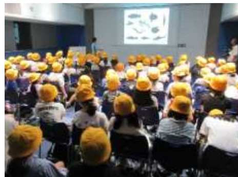
解説員の話聞く様子

今年度初めての3・4年生合同の活動を通して仲を深めることができました。今後も様々な行事、休み時間などでより仲を深めていきたいと思っています。