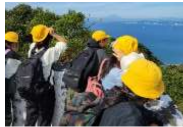
鋸山から眺める東京湾