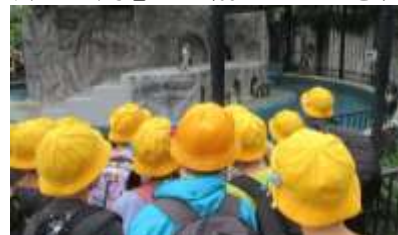
ペンギンを観察する様子