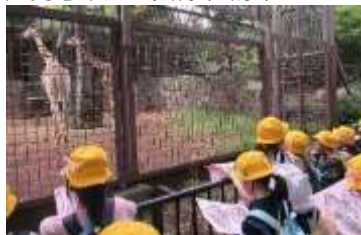
キリンを観察する様子

保護者の皆様には、持ち物の準備や朝早くからのお弁当の用意にご協力いただき、ありがとうございました。