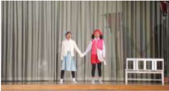
6年「夢から醒めた夢」

11月22日、23日の2日間で、無事に学芸会を実施することができました。子供たちは、表現する楽しさや、友達と切磋琢磨し一つのものを創り上げる喜びを味わうことができたのではないかと思います。ご家庭でも日々の練習への励ましや衣装等のご準備をしていただき、また、当日も多くの保護者・地域の皆様にご来校いただき、本当にありがとうございました。