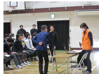
2/6 認知症サポーター養成講座 (2年)