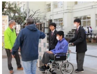
1/30 車いす体験 (1年)