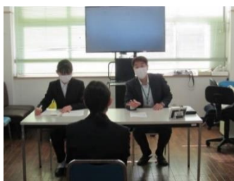
1/11 パワーアップ面接練習会(3年) (地域協力者による面接練習)