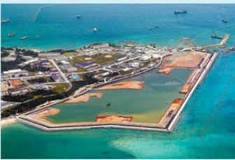
埋め立てが進む辺野古沖=3月26日

アメリカ(米)軍の普天間飛行場(沖縄県宜野湾市)の名護市辺野古への移設計画をめぐり、政府は21日、ゆるい地盤の改良工事など設計の変更を沖縄県に申請しました。