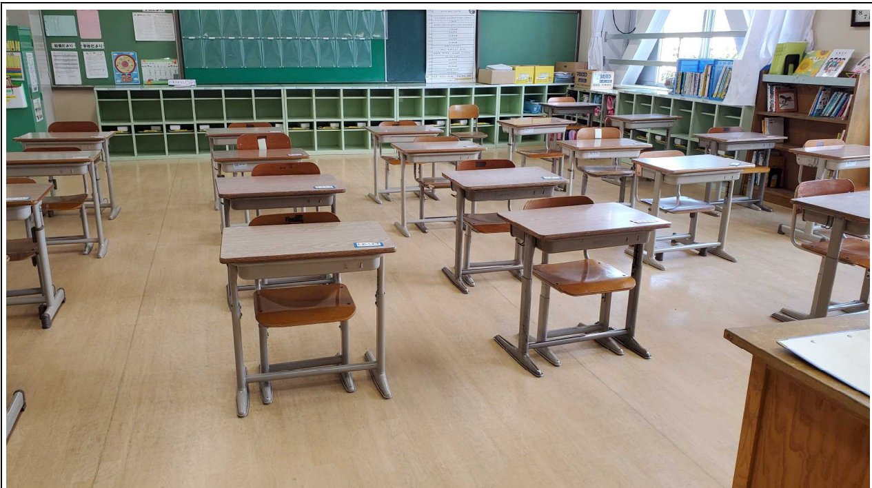
教室の中では、当然ソーシャルディスタンスを意識しての配置になっています。