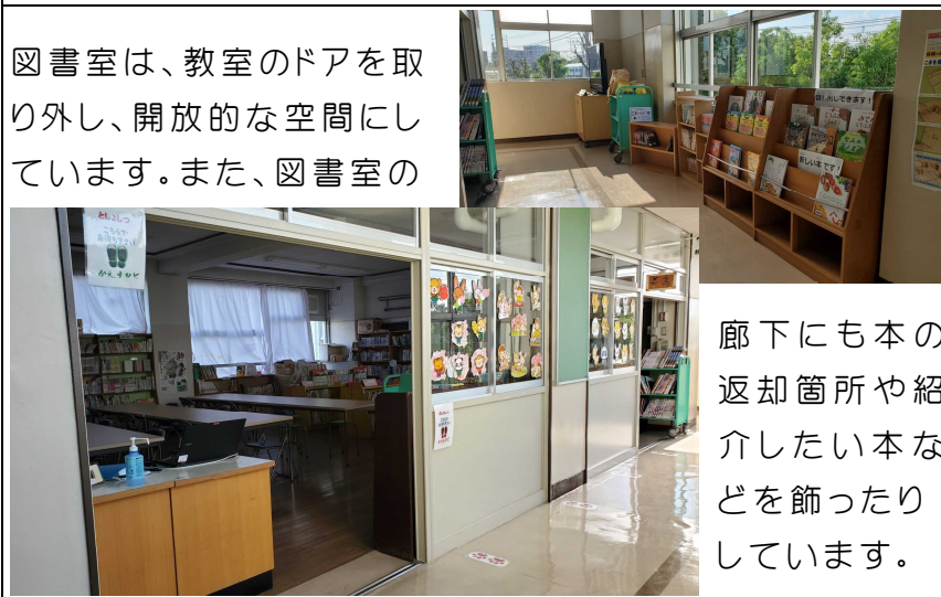
図書室は、教室のドアを取り外し、開放的な空間にしています。また、図書室の

ソーシャルディスタンスを保っていくために、トイレや図書室前、保健室（定期健康診断に備え）等に、人と人との間隔を示す印がつけられています。