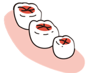
かみ合わせの部分